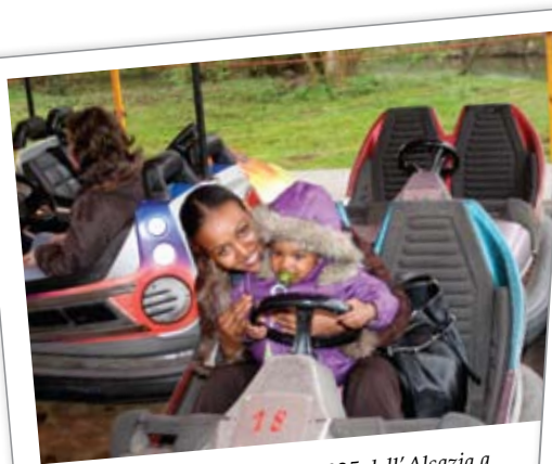
I club Kiwanis della Divisione 925 dell'Alsazia a Nord del Distretto France-Monaco: hanno invitato bambini svantaggiati ad un parco divertimenti.