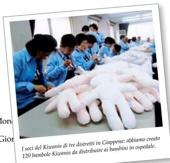
I soci del Kiwanis di tre distretti in Giappone: abbiamo creato 120 bambole Kiwanis da distribuire ai bambini in ospedale.

Passa in rassegna il Piano d'azione e ti renderai conto di quanto sia semplice organizzare la Giornata Mondiale Kiwanis. Prendi ispirazione da storie di successo passate. Informa i media utilizzando i vari mezzi di comunicazione disponibili. Inizia subito!