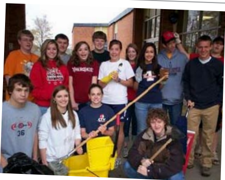
Il Key Club della scuola superiore, South Doyle High School, di Knoxville, Tennessee: hanno aiutato lo staff a pulire diverse classi e parti della scuola.