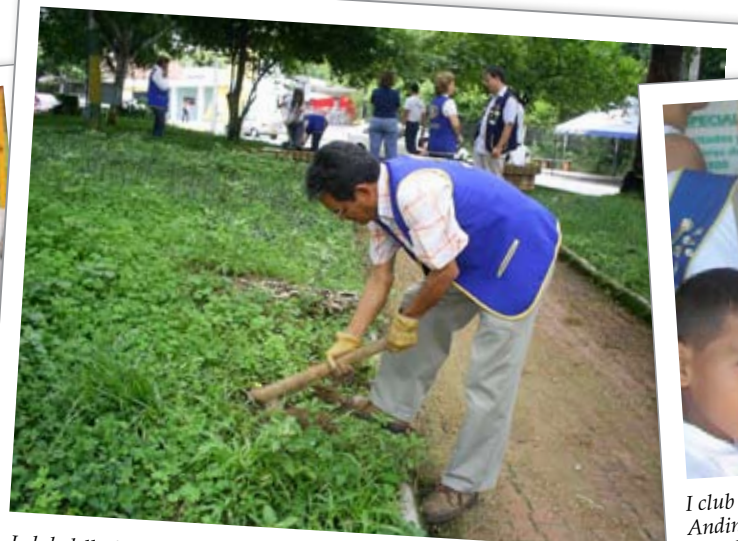
I club della famiglia Kiwanis di Bucaramanga, in Colombia: hanno pulito un parco della città.