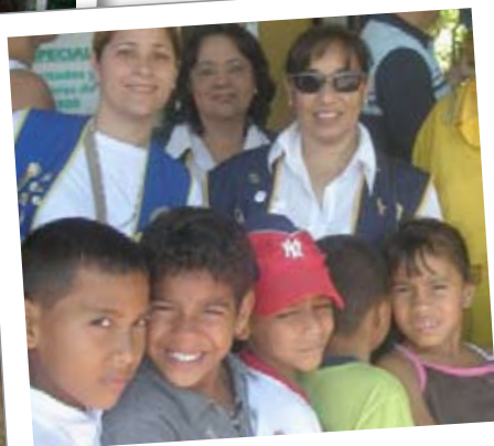
I club Kiwanis della Divisione 1 del distretto Andino e del Centro America: hanno portato allo zoo i bambini dell'orfanatrofio della zona.

DATE FUTURE PER LA GIORNATA MONDIALE KIWANIS