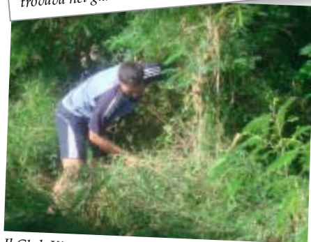
Il Club Kiwanis di Ralia Koumac, Nuova Caledonia: toglie le erbacce, taglia gli alberi e dipinge le panchine lungo il percorso nella Natura.