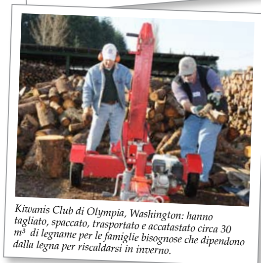
Kiwanis Club di Olympia, Washington: hanno tagliato, spaccato, trasportato e accatastato circa 30 m 3 di legname per le famiglie bisognose che dipendono dalla legna per riscaldarsi in inverno.