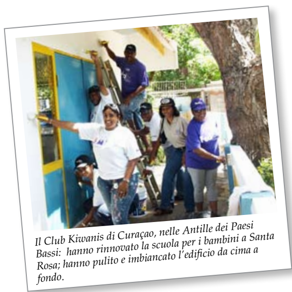
Il Club Kiwanis di Curaçao, nelle Antille dei Paesi Bassi: hanno rinnovato la scuola per i bambini a Santa Rosa; hanno pulito e imbiancato l'edificio da cima a fondo.

Queste domande sono intese ad aiutare la commissione a proporre idee e a vagliare concretamente la competenza dei volontari. Sogna in grande, ma sii realista!