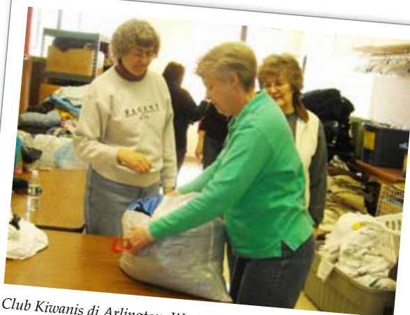
Club Kiwanis di Arlington, Washington: hanno lavato, stirato e selezionato gli abiti al Kids Klostet, un'organizzazione che distribuisce abiti e materiale scolastico ai bambini bisognosi.

Passa subito in rassegna il piano d'azione e inizia!