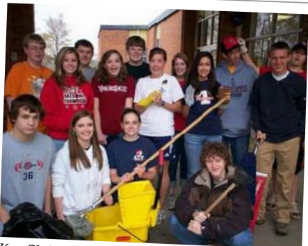
Key Club van South Doyle High School, Knoxville, Tennessee: Het toezichthoudende bestuur met personeelsgebrek geholpen door de voorraadkamers en kunstkamers van de school schoon te maken.

Tot slot kun je ook ideeën voor projecten bespreken. Ga na welk soort project in jullie gemeenschap en met jullie middelen haalbaar is. Heb je een project in gedachten dat echt zinvol zou kunnen zijn? Bekijk de voorstellen en maak een 'shortlist' van alle voorgelegde ideeën. Je hoeft vandaag geen beslissing te nemen, maar een eerste selectie is zeker aan te raden. Beleg een volgende vergadering binnen de eerstkomende twee weken, waarop de definitieve keuze zal worden gemaakt!