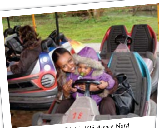
Kiwanis-clubs van Divisie 925 Alsace Nord (Noordelijke Elzas) van het district Frankrijk-Monaco: Kansarme kinderen uitgenodigd in een pretpark.