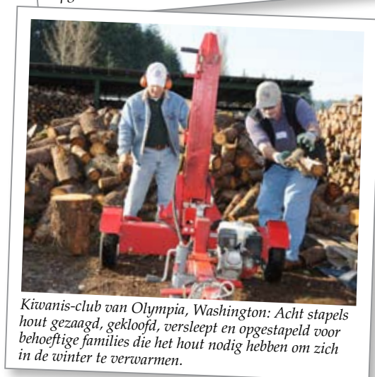
Kiwanis-club van Olympia, Washington: Acht stapels hout gezaagd, gekloofd, verslept en opgestapeld voor behoeftige families die het hout nodig hebben om zich in de winter te verwarmen.