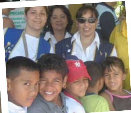
Divisie 1-clubs van het Kiwanis-district Andes en Midden-Amerika: Met de kinderen uit het regionale weeshuis naar de dierentuin geweest.