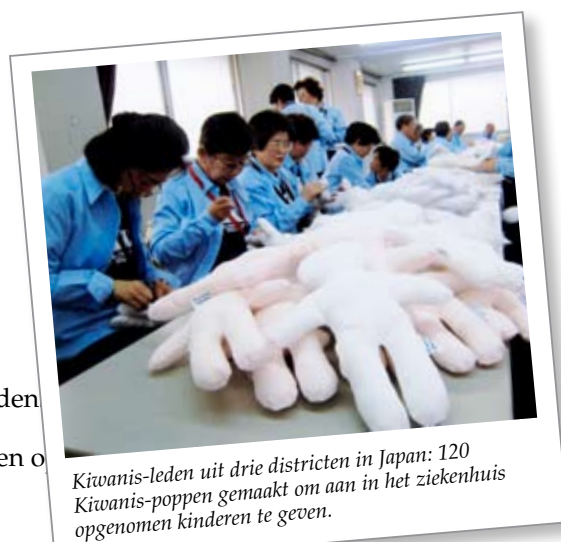
Kiwanis-leden uit drie districten in Japan: 120 Kiwanis-poppen gemaakt om aan in het ziekenhuis opgenomen kinderen te geven.

Eén blik op het stappenplan toont dat Kiwanisdag verbluffend eenvoudig kan zijn. Vergaar ideeën uit vroegere succesverhalen. Licht de media in met behulp van de talrijke informatiekanalen. Ga vandaag nog aan de slag!