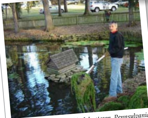
Kiwanis-club Westwood in Johnstown, Pennsylvania: Een vijver schoongemaakt op het terrein van het plaatselijke kunstencentrum.