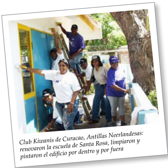
Club Kiwanis de Curacao, Antillas Neerlandesas: renovaron la escuela de Santa Rosa, limpiaron y pintaron el edificio por dentro y por fuera

La intención de estas preguntas es ayudar en la lluvia de ideas del comité y evaluar las fortalezas de los voluntarios. Sueña en grande, pero sea realista.