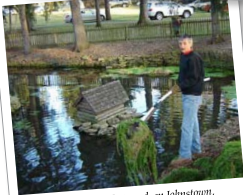
El Club Kiwanis de Westwood, en Johnstown, Pennsylvania: limpiaron un estanque ubicado dentro de los terrenos del centro de artes de la comunidad