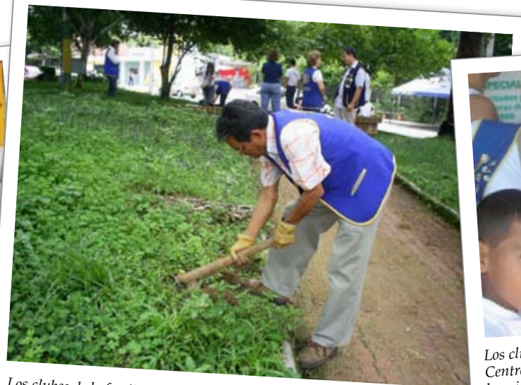
Los clubes de la familia Kiwanis de Bucaramanga, Colombia: limpiaron un parque de la ciudad