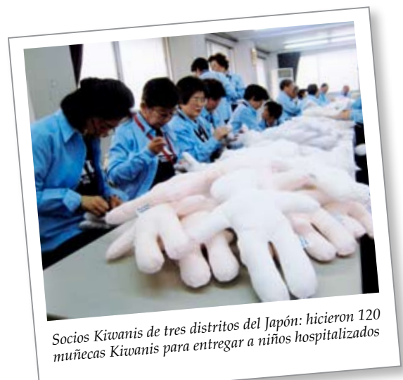
Socios Kiwanis de tres distritos del Japón: hicieron 120 muñecas Kiwanis para entregar a niños hospitalizados

Revise el plan para conocer lo sencillo que puede ser el Día Mundial Kiwanis. Inspírese con las historias exitosas anteriores. Informe a los medios de comunicación a través de los diferentes recursos disponibles. ¡Comience hoy!