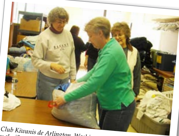
Club Kiwanis de Arlington, Washington: lavaron, plancharon y clasificaron ropa en Kids Klose, una organización que regala ropa y artículos escolares a niños necesitados