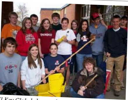
El Key Club de la escuela South Doyle High School, Knoxville, Tennessee: apoyó a un grupo de empleados de una escuela, la cual se encontraba escasa de personal, limpiando los depósitos y los salones de arte de la escuela

Finalmente, comience haciendo un debate sobre ideas para proyectos. Discuta, según sus recursos, qué es apropiado para su comunidad. ¿Existe un proyecto que pudiera tener gran impacto? Revise la lista de proyectos sugeridos y cree una “lista corta” de ideas. No necesita tomar hoy una decisión sobre su proyecto, pero debería estar camino de finalizar la selección. Programe una reunión de seguimiento dentro de las dos semanas siguientes y ¡prepárese para seleccionar su proyecto del Día Mundial Kiwanis!