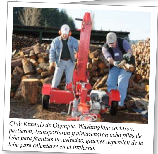
Club Kiwanis de Olympia, Washington: cortaron, partieron, transportaron y almacenaron ocho pilas de leña para familias necesitadas, quienes dependen de la leña para calentarse en el invierno.