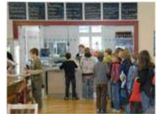
Todos los estudiantes de Müllheimer reciben igual trato en la cafetería de su escuela, sin importar la situación financiera, gracias al Club Kiwanis de Badenweiler-Müllheim, Alemania.

El costo de una comida diaria para los estudiantes de Müllheimer es de 3.30 euros. Disponen de una tarifa diaria reducida de 1.50 euros, pero los padres deben probar que necesitan ayuda financiera. El subsidio del club Kiwanis suprime el requisito de esta prueba. Además, el obsequio Kiwanis puede utilizarse para ayudar a los estudiantes que requieren apoyo con las tareas, lecciones de música y otras necesidades educativas.